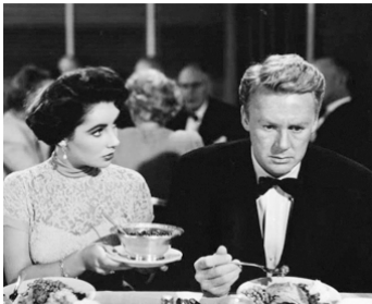
1949 LE CHEVALIER DE BACCHUS (The Big Hangover) de Norman Krasna avec Van Johnson