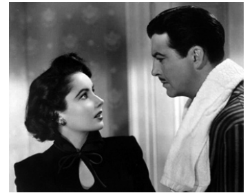
1949 GUET-APENS (Conspirator) de Victor Saville avec Robert Taylor