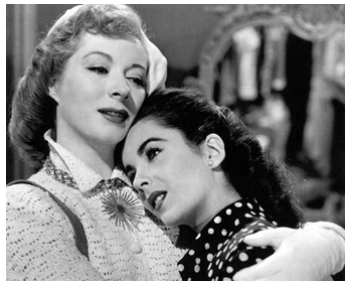
1948 LA BELLE IMPRUDENTE (Julia Misbehaves) de Jack Conway avec Greer Garson