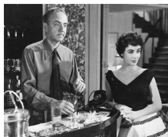
1952 LA FILLE QUI AVAIT TOUT (The girl who had everything) de R. Thorpe avec W. Powell