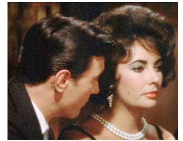
1960 VÉNUM EN VÉNUM (Butterfield 8) de Daniel Mann avec Laurence Harvey