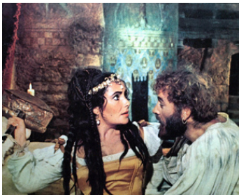
1966 LA MÉGÈRE APPRIVOISÉE (The Taming of the Shrew) de Franco Zeffirelli avec R. Burton