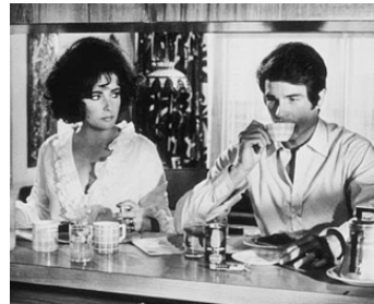
1969 LAS VEGAS, UN COUPLE (The only game in town) de G. Stevens avec Warren Beatty