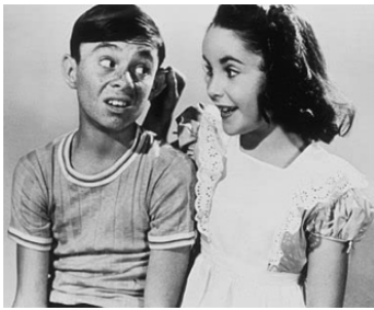
1942 THERE'S ONE BORN EVERY MINUTE d'Harold Young avec Carl Schwitzer