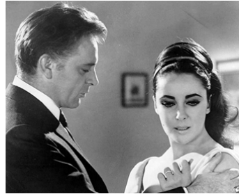
1963 HÔTEL INTERNATIONAL (The V.I.P.'s) d'Anthony Asquith avec Richard Burton