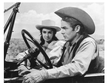
1956 GÉANT (Giant) de Georges Stevens avec James Dean