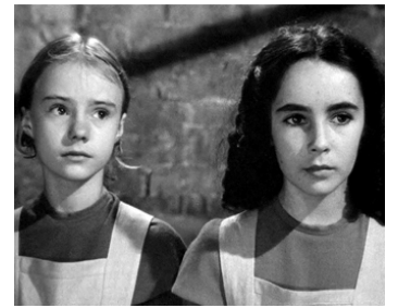
1944 JANE EYRE (Jane Eyre) de Robert Stevenson avec Peggy Ann Garner