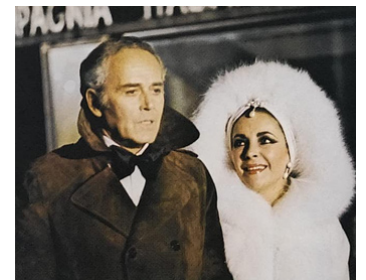
1973 NOCES DE CENDRES (Ash Wednesday) de Larry Pierce avec Henry Fonda