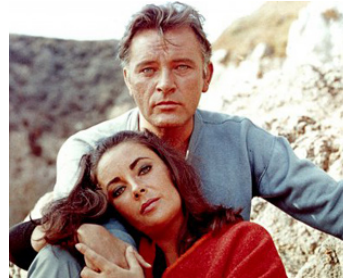
1964 LE CHEVALIER DES SABLES (The Sandpiper) de Vincente Minnelli avec Richard Burton