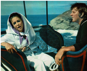
1968 BOOM ! (Boom !) de Joseph Losey avec Richard Burton