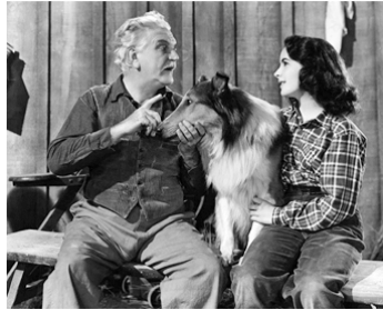
1945 LE COURAGE DE LASSIE (Courage of Lassie) de Fred M. Wilcox avec Frank Morgan