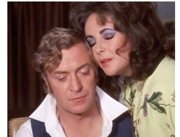
1970 UNE BELLE TIGRESSE (X, Y and Zee) de Brian G. Hutton avec Michael Caine