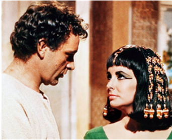
1963 CLÉOPÂTRE (Cleopatra) de Joseph L. Mankiewicz avec Richard Burton