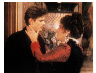
1987 TOSCANINI (Il giovane Toscanini) de Franco Zeffirelli avec C. Thomas Howell