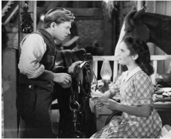
1944 LE GRAND NATIONAL (The National Velvet) de Clarence Brown avec Mickey Rooney