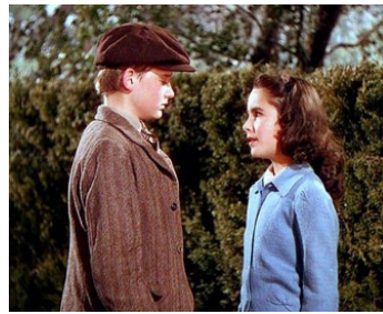
1943 LA FIDÈLE LASSIE (Lassie come home) de Fred M. Wilcox avec Roddy McDowall