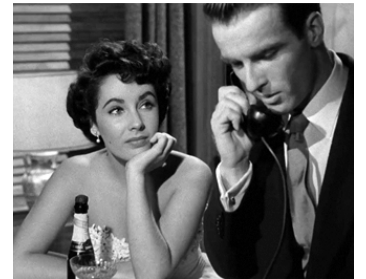
1951 UNE PLACE AU SOLEIL (A Place in the Sun) de George Stevens avec Montgomery Clift