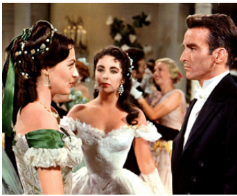
1957 L'ARBRE DE VIE (Raintree County) d'Edward Dmytryk avec Jarna Lewis, Montgomery Clift