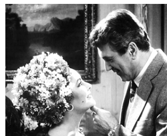
1979 LE MIROIR SE BRISA (The Mirror crack'd) de Guy Hamilton avec Rock Hudson