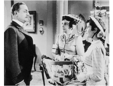
1947 MON PÈRE ET NOUS (Life with Father) de M. Curtiz avec William Powell, ZaSu Pitts