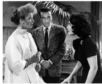
1959 SOUDAIN, L'ÉTÉ DERNIER (Suddenly last summer) de J. Mankiewicz avec K. Hepburn, M. Clift