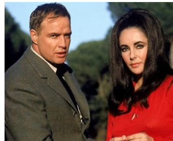
1967 REFLETS DANS UN ŒIL D'OR (Reflections in a golden eye) de J. Huston avec M. Brando