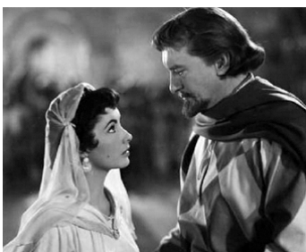
1951 IVANHOÉ (Ivanhoe) de Richard Thorpe avec George Sanders