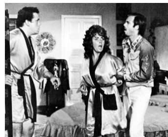
1971 LIBERTÉ PROVISOIRE (Hammersmith is out) de P. Ustinov avec John Schuck, Beau Bridges