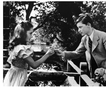
1943 LES BLANCHES FALAISES DE DOUVRES (The white cliffs of Dover) de C. Brown avec R. McDowall