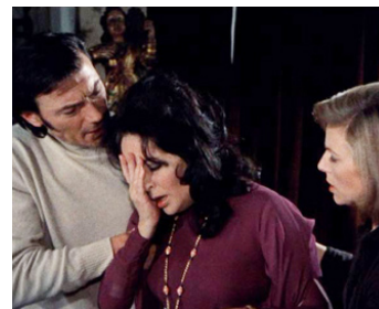
1972 TERREUR DANS LA NUIT (Night Watch) de Brian G. Hutton avec L. Harvey, B. Whitelaw