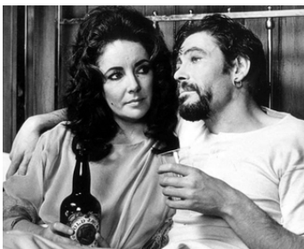
1971 AU BOIS LACTÉ (Under Milk Wood) d'Andrew Sinclair avec Peter O'Toole