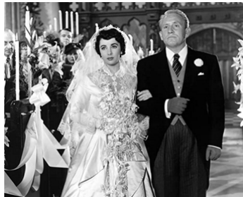
1950 LE PÈRE DE LA MARIÉE (Father of the Bride) de Vincente Minnelli avec Spencer Tracy