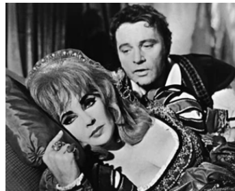
1966 DOCTEUR FAUST (Doctor Faustus) de Richard Burton avec R. Burton