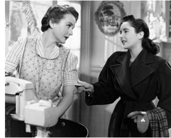
1946 CYNTHIA (Cynthia, the rich full life) de Robert Z. Leonard avec Mary Astor