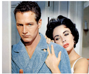
1958 LA CHATTE SUR UN TOIT BRÛLANT (Cat on a hot tin roof) de R. Brooks avec Paul Newman