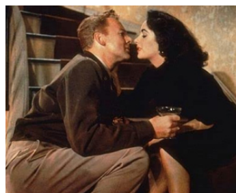
1954 LA DERNIÈRE FOIS QUE J'AI VU PARIS (The last time...) de R. Brooks avec Van Johnson