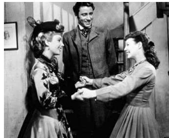
1949 LES 4 FILLES DU DR MARCH (Little Women) de M. LeRoy avec Peter Lawford, June Allyson