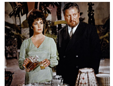
1967 LES COMÉDIENS (The Comedians) de Peter Glenville avec Peter Ustinov