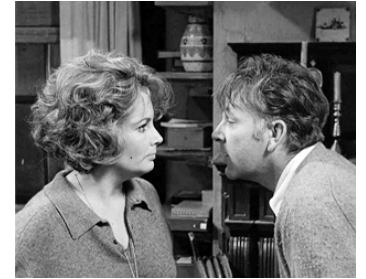
1965 QUI A PEUR DE VIRGINIA WOOLF ? (Who's afraid of V. Woolf) de M. Nichols avec R. Burton