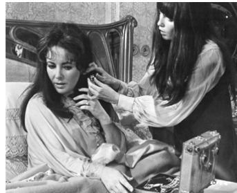
1968 CÉRÉMONIE SECRÈTE (Secret Ceremony) de Joseph Losey avec Mia Farrow