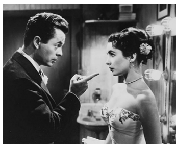
1952 RUSE D'AMOUR (Love is better than ever) de Stanley Donen avec Larry Parks