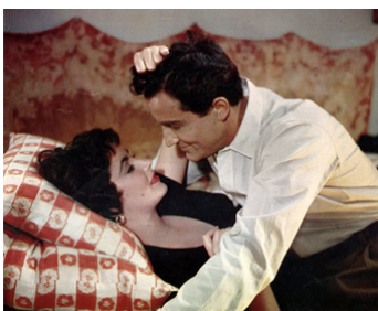
1954 RHAPSODIE (Rhapsody) de Charles Vidor avec Vittorio Gassman