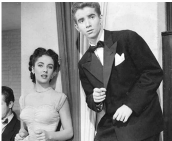
1948 AINSI SONT LES FEMMES (A Date with Judy) de Richard Thorpe avec Scotty Beckett