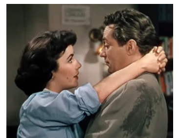
1953 LA PISTE DES ÉLÉPHANTS (Elephant Walk) de William Dieterle avec Peter Finch